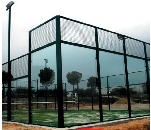
Pista de pádel

Además es gratificante anunciar que en las últimas semanas ha dado frutos el duro trabajo que venía desarrollando el Ayuntamiento desde el principio de su gestión en esta área; se acaba de publicar el comienzo inminente de las obras de construcción del "Área Deportiva Recreativa Municipal", con cargo al PRISMA 2007-2011 y se ha recibido la confirmación de la inclusión de Villanueva en el Programa de Actuación para la implantación de Césped Artificial en Campos Municipales de Fútbol.