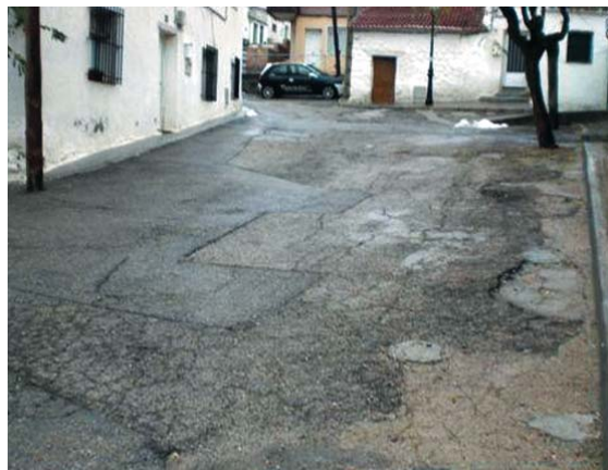
Estado actual de la calle Cruz

En breve comenzarán las obras de recuperación de la calle Cruz con cargo a este nuevo Plan. Esta calle es la continuación natural de la calle Real por el lado este, y comparativamente, pone de manifiesto, aún más si es posible, el actual estado de deterioro de esta vía pública.