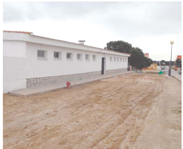
Foto del aparcamiento del campo de fútbol