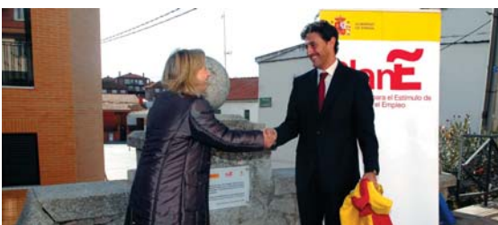
Descubrimiento de placa en la calle Real

La delegada del gobierno expresó su apoyo al municipio, afirmando que era intención del Gobierno Central seguir trabajando para contribuir al desarrollo local de los pueblos de toda la geografía.