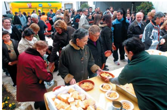
Numerosos vecinos acudieron a degustar un sabroso cocido